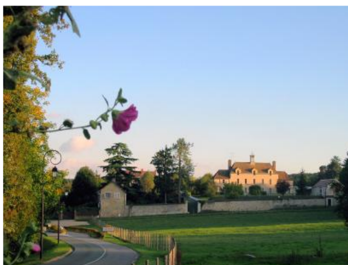
L'entrée du Village

Saint-Lambert-des-Bois est une petite commune rurale située dans l'est du département des Yvelines. Constituée du cœur du village, de deux hameaux (La Brosse et Vaumurier) et de la ferme de Champ-Garnier, la commune est riche d'un patrimoine naturel et historique. Le prestige de l'ancienne abbaye de Port-Royal et son appartenance au Parc Naturel de la Haute Vallée de Chevreuse font de Saint-Lambert des Bois un refuge de calme et de verdure en région parisienne. L'intégration d'activités économiques dynamiques et la création de structures sportives et festives contribuent à l'animation et au développement du territoire.